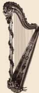
Harfe der Königin Marie Antoinette, 18. Jahrhundert