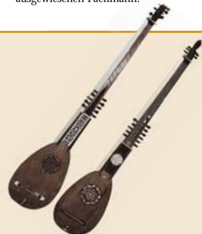
Bass-Gitarren, 16. Jahrhundert

Instrumente auch wieder erklingen zu lassen. „Mein Wunsch ist, durch erläuternde Vorträge und stilgerecht ausgeführte Konzerte mit Benutzung alter Instrumente nach Kräften zur Wiederbelebung der Musik vergangener Zeiten beizutragen“, so Heyer selbst. Seine Museumsgründung galt als einer der Motoren, um in Köln das Augenmerk wieder auf die Alte Musik