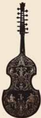
Viola d'amore, 1714

Beschreibung der Beethovenschen Werke – gewann Heyer für die Erstellung eines Katalogs, der aufgrund der Fülle des Materials dreibändig ausfiel, einen ausgewiesenen Fachmann.